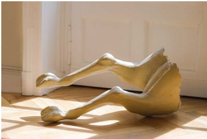
Anne Lebréquer, L'Échiné (détail) , 2023. Résine, fibre de verre, tubes aluminium jonctions métal, fer, cuir, tiges filetées, béton, dimensions variables. Vue d'exposition à l'École Supérieure d'Art et de Design TALM, Angers.