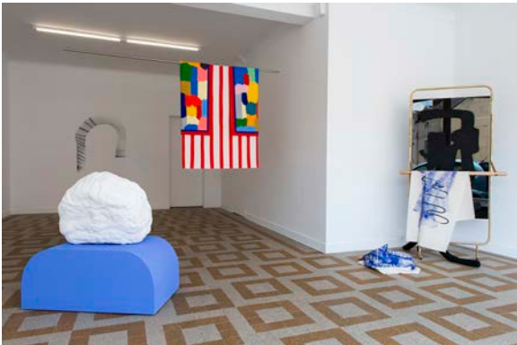
Vue de l'exposition collective Entre deux eaux (cur. Anne-Lou Vicente) à MEAN en 2018. Photographie Marc Damage.