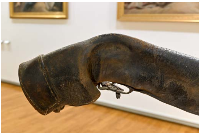
Anne Lebréquer, Dans des blessures, des boues, des grands fracas (détail) , 2024. Cuir, fer acier, platine acier, dimensions variables. Vue d'exposition, Musée d'Art et d'Histoire de Cholet