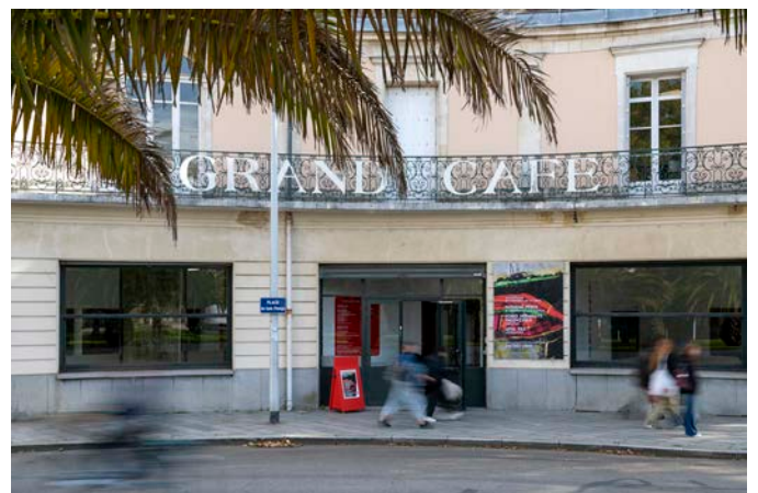
Le Grand Café - centre d'art contemporain, Saint-Nazaire, 2024.