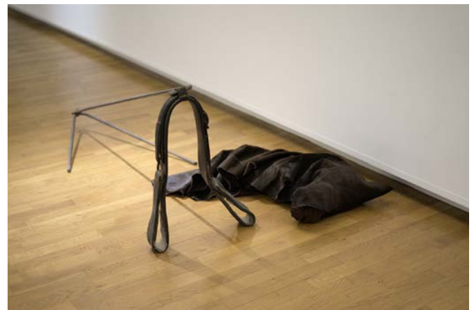
Anne Lebréquer, Dans des tranchées, dans des fossés, à l'envers du silence , 2024. Peaux, mousse, cuir, acier, dimensions variables. Vue d'exposition, Musée d'Art et d'Histoire de Cholet © Photographie Maëlle Bléteau.