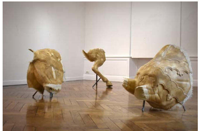
Anne Lebréquer, Avec hennir comme dernier cri parce qu'humanité avalée , 2024. Résine, fibre de verre, acier, dimensions variables, dimensions variables. Vue d'exposition, Musée d'Art et d'Histoire de Cholet.