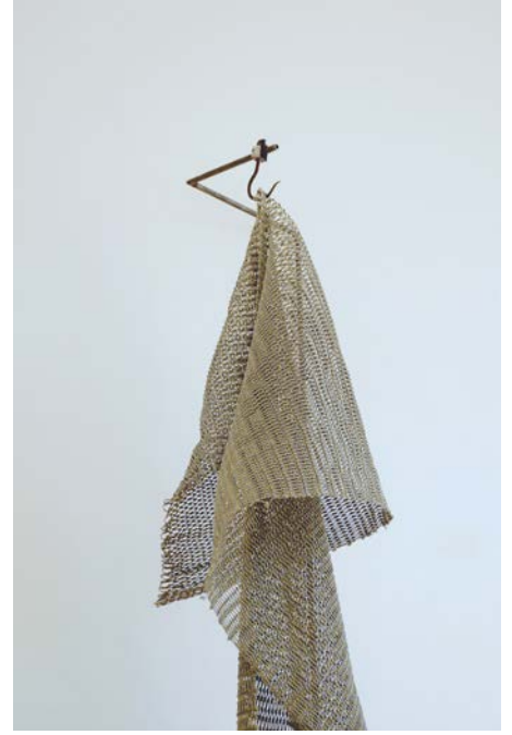
Anne Lebréquer, Le Cercle d'eau ne s'ouvrira pas (détail) , 2023. Fil polyéthylène, crochet forgé, fers ronds acier soudés, dimensions variables.