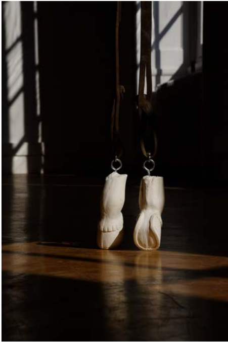
Anne Lebréquer, Foulée , 2023. Cuir, fil polyester, plâtre, acier zingué, 6 x 30 x 300 cm. Vue d'exposition à l'École Supérieure d'Art et de Design TALM, Angers.

Ces visuels sont disponibles en haute-définition sur simple demande. Merci de respecter et de mentionner la légende et le crédit photo lors des reproductions.