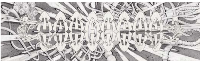
Roy Köhnke, HAHAHAHAHA , 800 x 240 cm, dessin pour l'exposition La Belle sucette au Radôme, Saint-Nazaire, 2024 © ADAGP, Paris, 2025