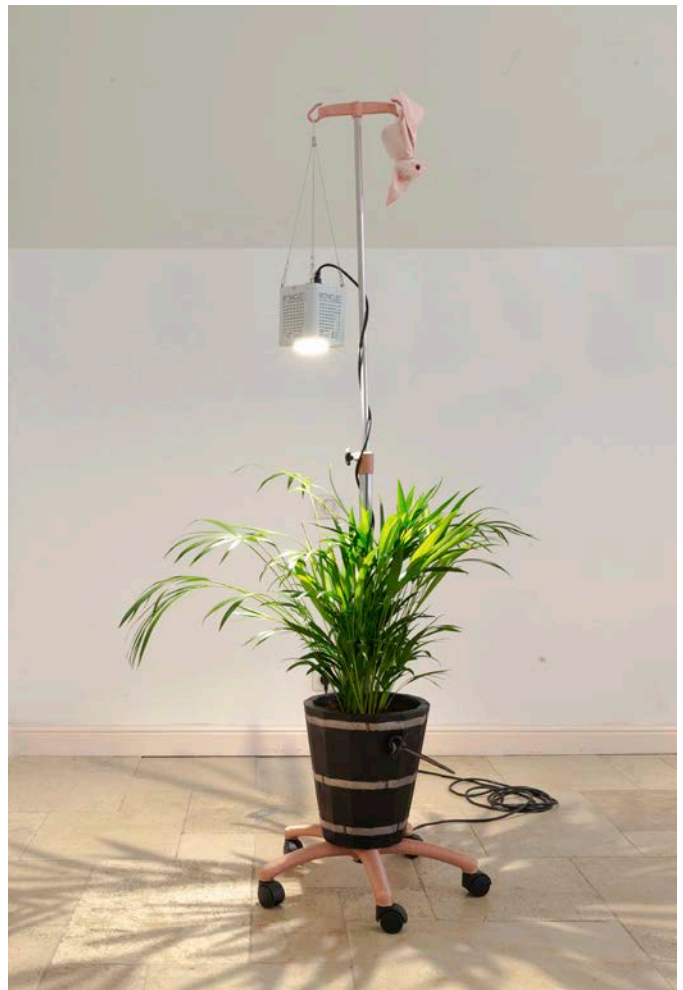
Benoît Piéron, Plante de salle d'attente , 2022. Collection Frac Bretagne © Benoît Piéron. Photographie Benoît Piéron.

Les contemplations sur l'expérience de l'attente et l'interaction complexe entre la santé et la maladie sont au cœur de la pratique de Benoît Piéron. Son travail explore les frontières subtiles qui existent entre la présence et l'absence, l'intérieur et l'extérieur, le corps humain et les structures architecturales qui l'entourent, ainsi que les aspects temporels des institutions médicales qui façonnent l'expérience du patient.