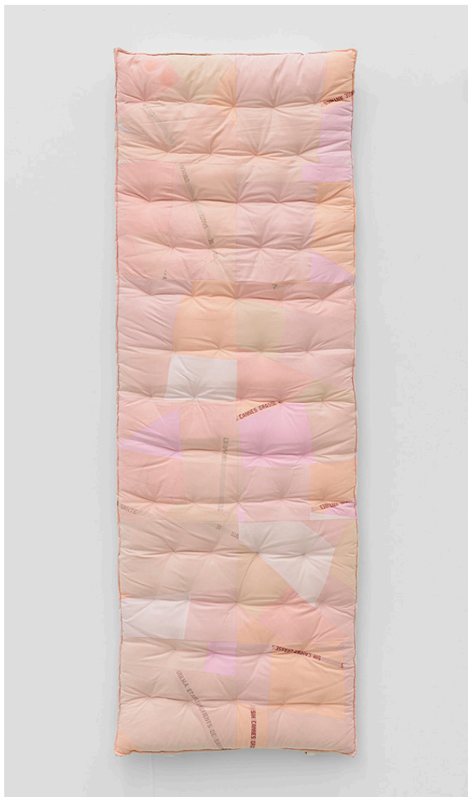
Benoît Piéron, Matelas de plage III , 2022. Collection Frac Bretagne. © Benoît Piéron.