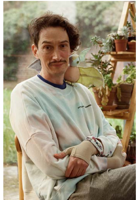
Photographie Nanténé Traoré

2010 : Le Peuple des pyjamas au royaume des coquillettes , Les Capucins, Embrun, cur. Benoît Piéron & Mathilde Belouali ; Programmation hors-les-murs du LAM Lille, Hall B, Roubaix, cur. Marie-Amélie Senot ; In the Hours Between Dawns , IAC Villeurbanne, cur. Sarah Caillet