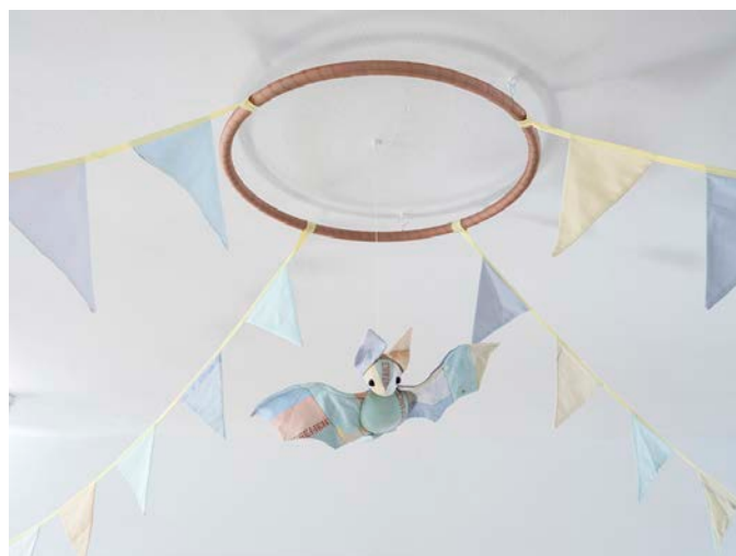
Benoît Piéron, Maye Pole , vue de l'exposition Der pinkelnde Tod or What the Dead Do au Kunstverein Bielefeld, Bielefeld, 2023. © Kunstverein Bielefeld, Courtesy de l'artiste et Sultana, Paris. Photographie Fred Dott.