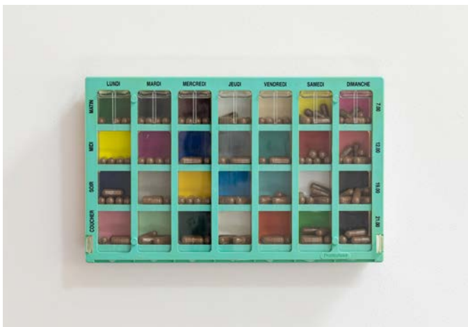
Benoît Piéron, Pillbox of Dungeness Seed Bombs , 2018. Collection Ronan Grossiat.